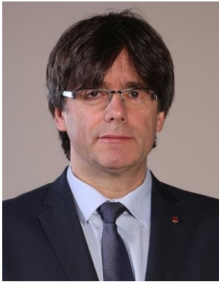
Carles Puigdemont Casamajó

Juntos por Cataluña es una coalición de ideología centro-derecha, independentista catalana entre el Partido Demócrata Europeo Catalán (PDeCAT) y Convergencia Democrática de Cataluña (CDC) . C.Puigdemont es miembro de su partido sucesor, el PDeCAT . Fue cesado en el cargo de presidente de la Generalitat en 2017, ( aplicación del artículo 155 de la Constitución española de 1978 ).