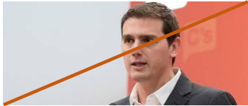
Albert RIVERA fundador Dimite en 2019